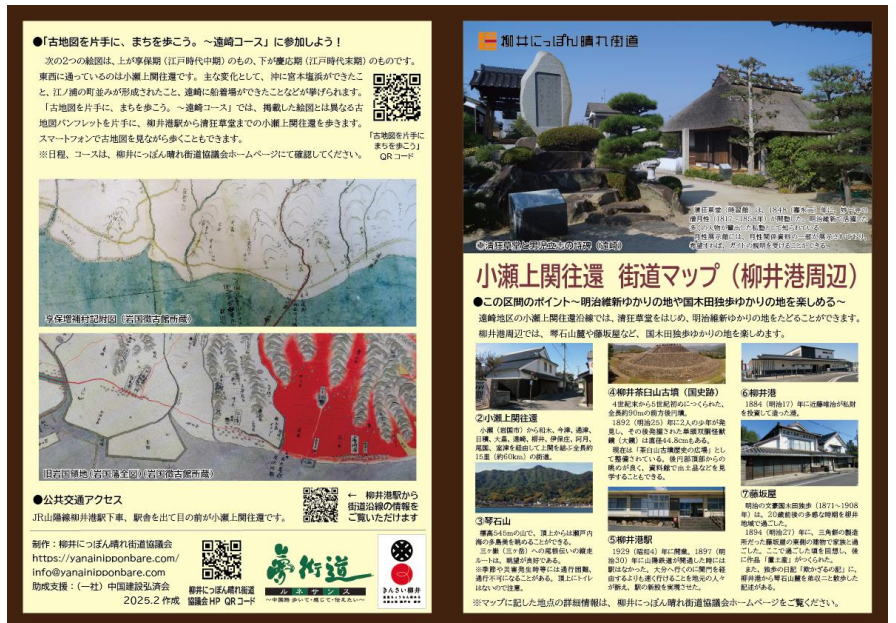
▲街道マップ 表紙・裏表紙(柳井港周辺)

令和7年度においては、残りのコースの作成(大畠駅周辺、中心市街地、伊保庄、伊陸、馬皿、新庄～余田)や、広域の地図、テーマ別地図の作成などに取り組むたいと考えております。