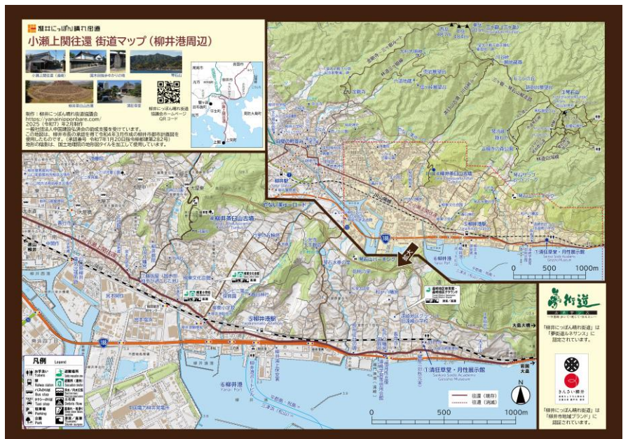
▲街道マップ 地図面(柳井港周辺)