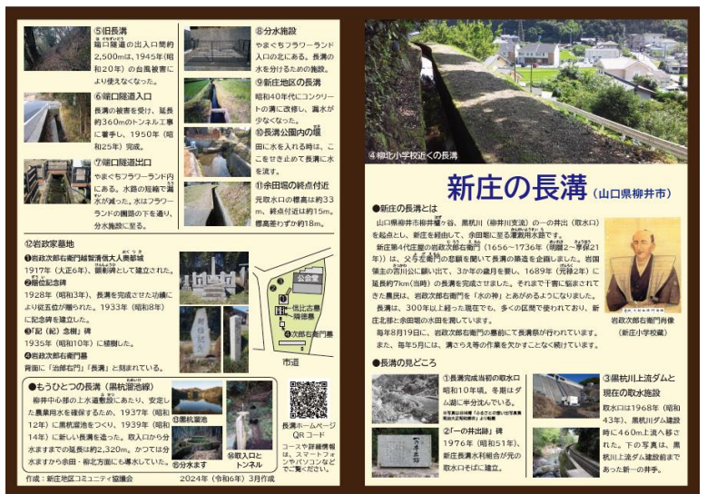
▲パンフレット表面