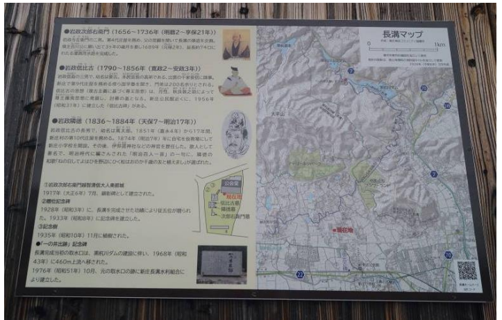
▲佐保公会堂に設置された看板