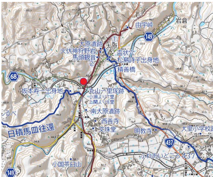
▲街道マップ表紙(日積～大島)