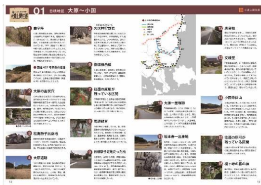
ガイドブックの中身（サンプル）